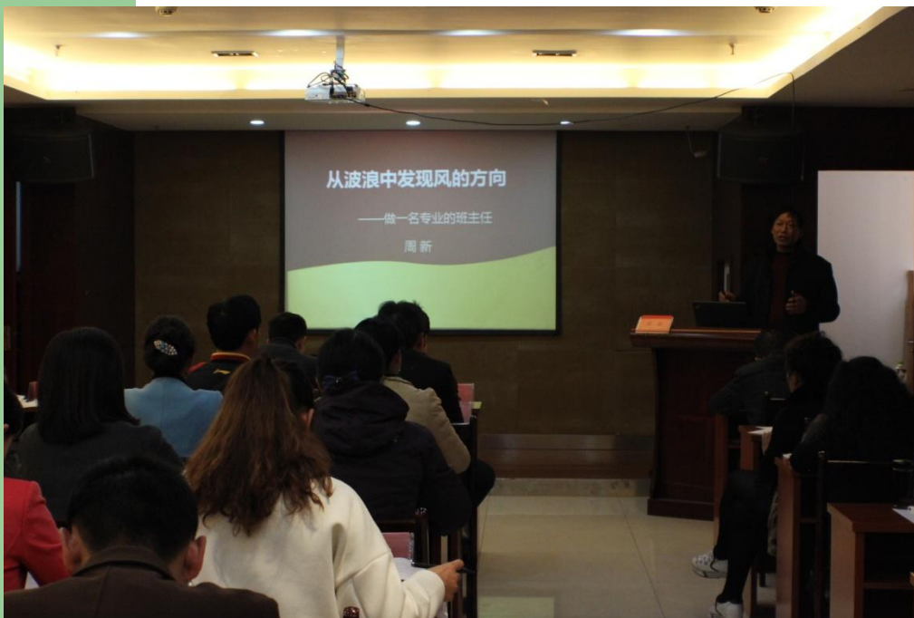
2015年为湖北省卓越 班主任高级研修班授课