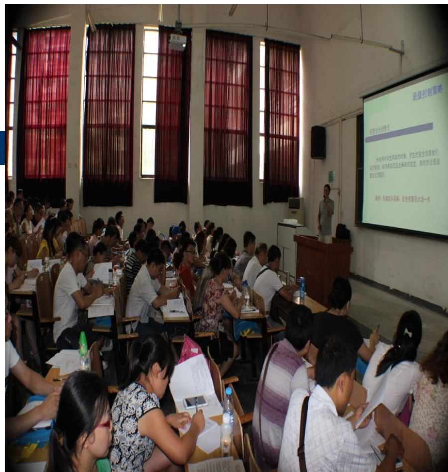
2013年在武汉城市学院为全省班主任作安全教育培训