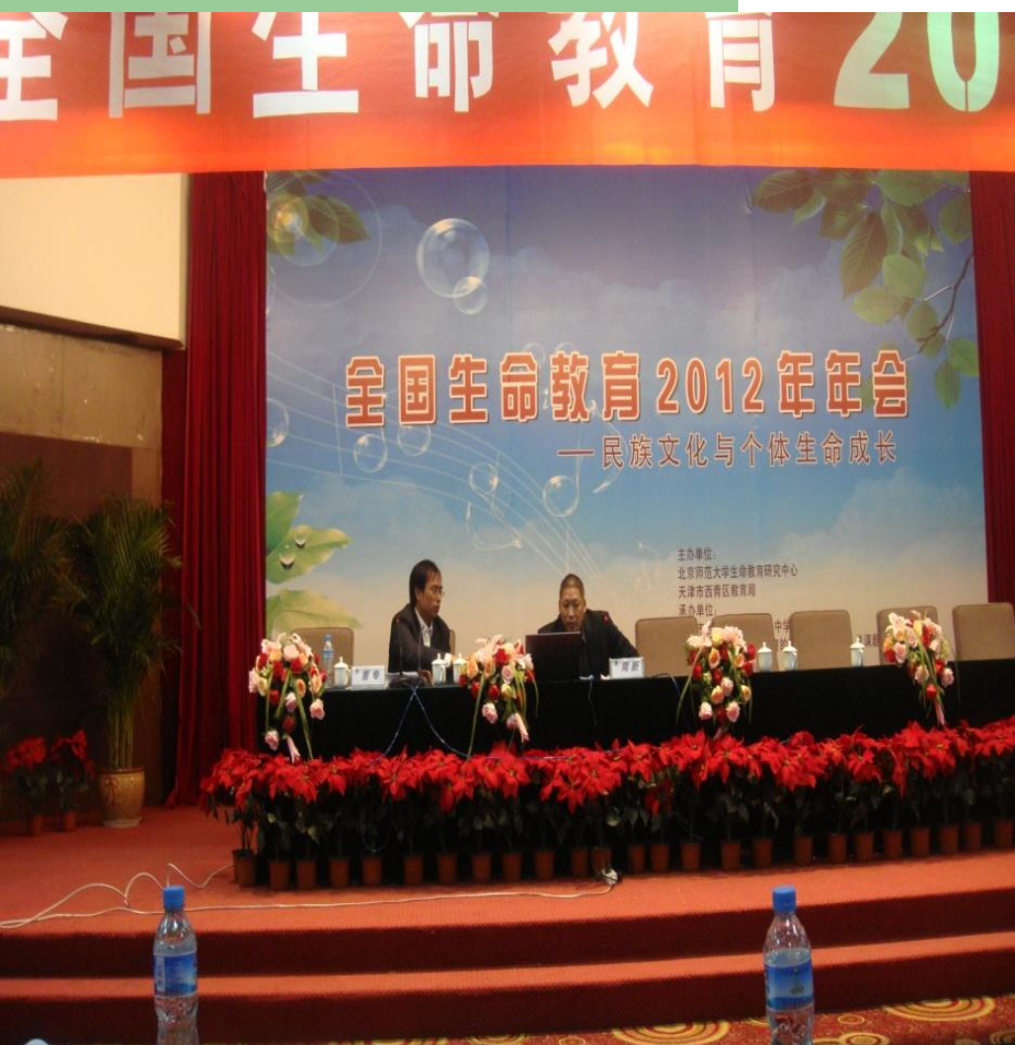
2012年在全国生命教育年会上作典型发言（右一）