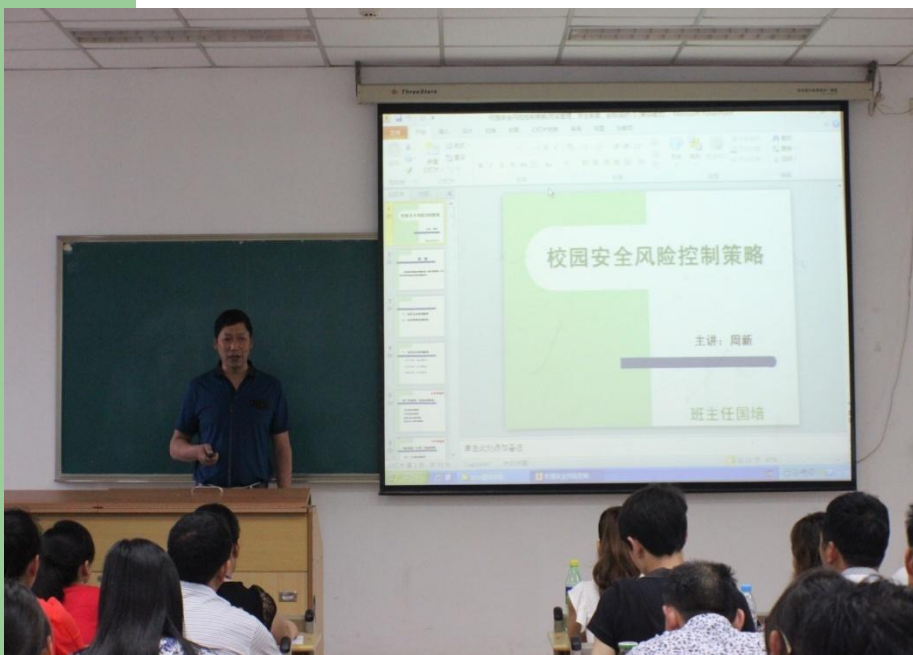
华中科技大学 2014年讲座照片