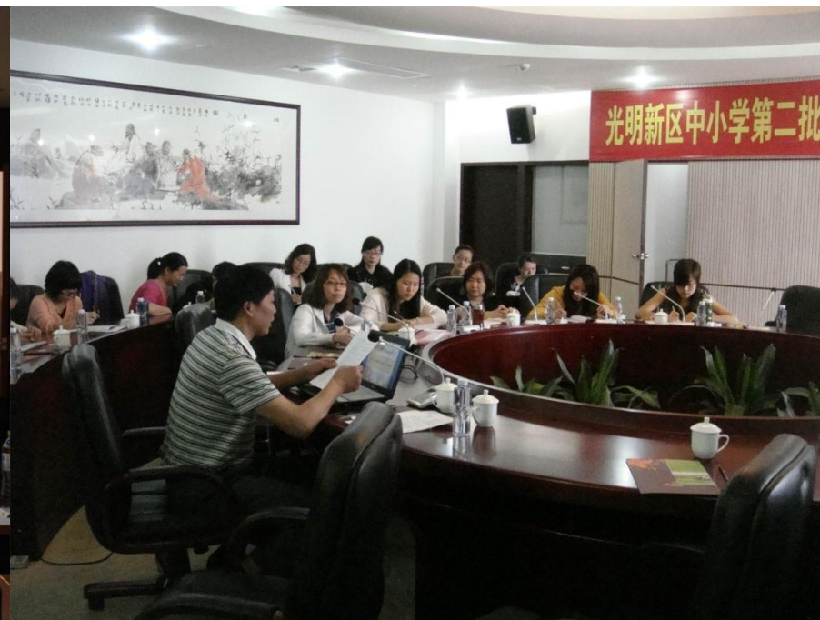
为深圳“名班主任” 作培训辅导